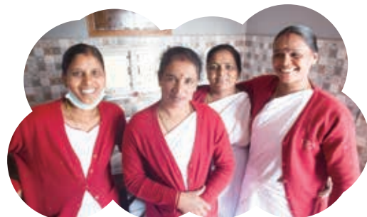
セラピストもみんなお母さんです

そう思ってできた今回の企画です。リラックス、身心のリセットは、こどもにも、周りの誰かの身心にも、きっと響いてきます。